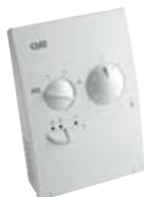
Regulation Pi V20C