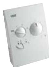
Regulation Pi V20C