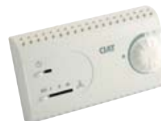
Regulation PI V200