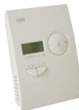
Regulation Pi V20C med display